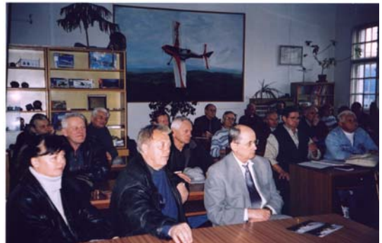
Členovia KVV Bratislava pri slávnostnom odovzdávaní členských preukazov.

Ústredie Klubu vojenských výsadkárov Slovenskej republiky v tomto roku vydalo nové členské preukazy pre svoju základňu. Preukazy boli veľmi žiadúce nielen pre potreby rôznych celoslovenských, či klubových akcií, ale i pre spresnenie celej členskej základne. Je nutné podotknúť, že sa celkom vydarili. A tak zavládla spokojnosť s preukazmi vo všetkých evidovaných kluboch veteránov na Slovensku.