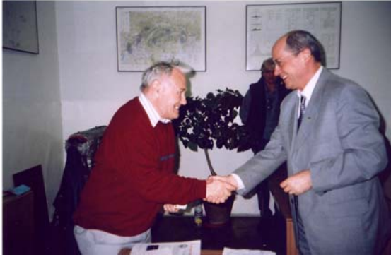
Pavel Franík pri odovzdávaní preukazu veteránovi Jánovi Čarnogurskému

Prvých 50 členských preukazov sme slávnostne odovzdali na našej pravidelnej koncomesačnej schôdzi KVV dňa 26. marca 2002. Medzi prvými členský preukaz prevzal náš kolega veterán JuDr. Ján Čarnogurský, minister spravodlivosti.