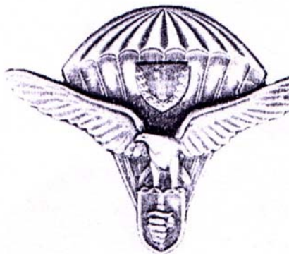
Výkonnostný odznak výsadkárov I. triedy