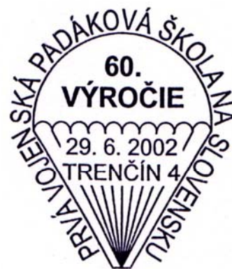
Príležitostné poštové pečiatky