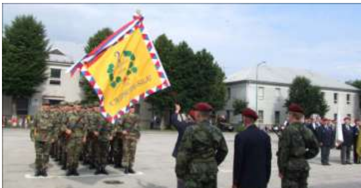
Replika zástavy 2. pdb v Žiline

Samozrejme, že tieto periodiká sa vzájomne menia s klubmi v ČR. A tak koluje u nás na Slovensku i Spravodaj, ktorý vydáva KVV Prostějov, Padáček KVV Praha, alebo Spravodaj KVV Zlín.