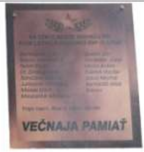
Tabuľa zo Slemä

- Výstup na Slemä - 1513 m n. m. k Pamätníku príslušníkov 2. čs. samostatnej paradesantnej brigády v ZSSR, ktorí zahynuli 13. októbra 1944 pri prelete na pomoc SNP. Tohto výstupu sa zúčastňujú členovia KVV SR, KVV ČR, príslušníci 5. pluku, vojenský prídelenci Ruska a Ukrajiny a ďalší. V roku 2009 to už bol 15. ročník.