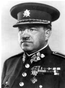
generál Ludvík Krejčí

V Československu sa z iniciatívy generála Krejčího začína vývoj výsadkových jednotiek v roku 1937-1938. Na ich tradíciu potom nadviazala 2. československá samostatná paradesantná brigáda v ZSSR, ktorá sa vyznamenala v bojoch na Dukle a potom v priebehu Slovenského národného povstania v roku 1944.