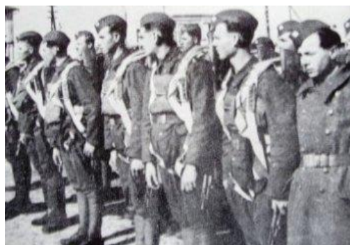
Známa fotografia príslušníkov 2. čs. samostatnej paradesantnej brigády v ZSSR v Jefremove.

a napokon bola schopná ešte prelomiť front a prebiť sa späť. Koncom februára 1945 príslušníci parabrigády sa sústredili v Kežmarku. Tu sa brigáda znovu formuje, dopĺňa a pripravuje pre záverečné boje 2. svetovej vojny. Počas presunu na front ju však zastihol koniec vojny. Jednotky brigády dostali rozkaz obsadiť južné územie Slovenska, ktoré bolo oslobodené od horthyovského Maďarska. Aj túto úlohu brigáda splnila.